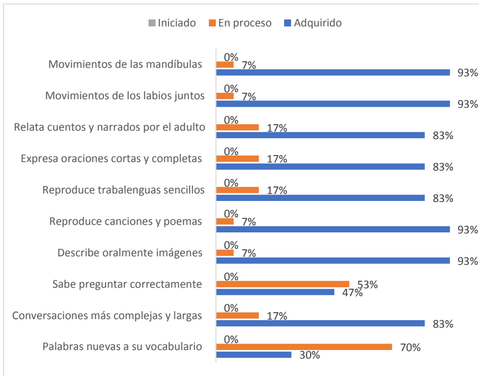
Figura 1. Proceso de desarrollo del lenguaje oral en estudiantes del nivel preparatorio en la Unidad Educativa El Carmen

En la figura 1 se muestran los resultados de las destrezas en el proceso de desarrollo del lenguaje oral en estudiantes del nivel preparatorio. Se observa que, de manera general todas las destrezas están en el ítem de adquirido lo que demuestra el cumplimiento de los objetivos para este tipo de enseñanza.