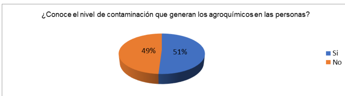
Figura 1. Conocimiento sobre el nivel de contaminación que generan los agroquímicos en las personas.

Análisis e interpretación: De acuerdo a lo observado en la tabla 1 y figura 1, se expone que el 51% de la población tiene conocimiento del nivel de contaminación que generan los agroquímicos utilizados en las bananeras y en menor porcentaje con el 49% manifiesta no tener conocimiento sobre el poder contaminante que tienen los agroquímicos, dentro de sus lugares de trabajo.