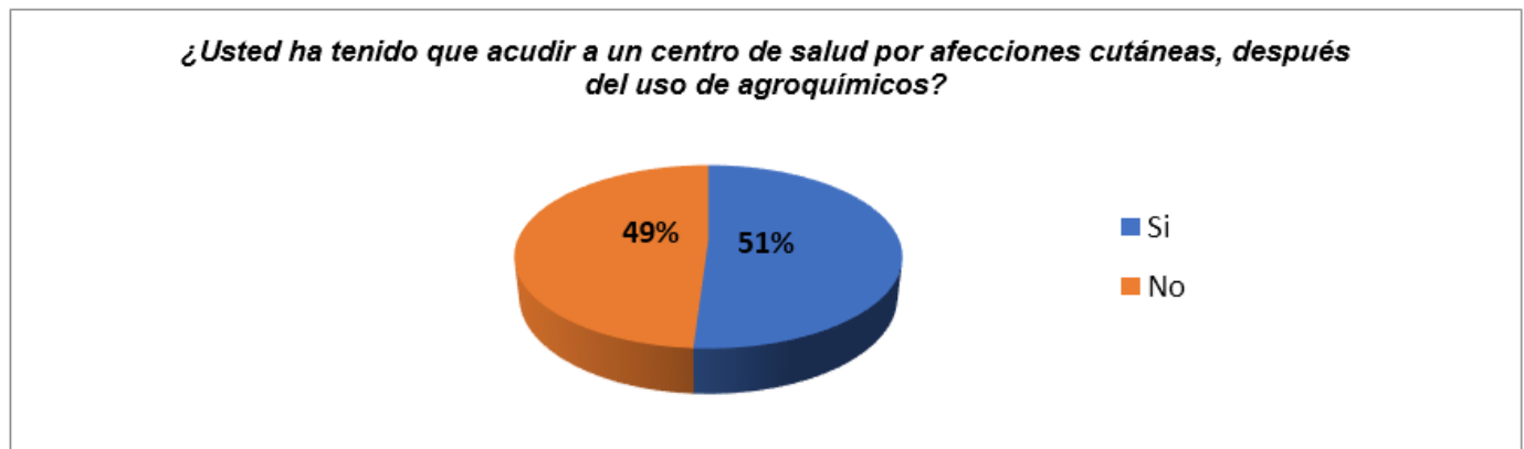
Figura 4. Necesidad de atención médica después del uso de agroquímicos.

Análisis e interpretación: De acuerdo a lo observado en la tabla el estudio nos indica que el 51 % de los encuestados manifiestan que a veces han acudido al su centro de salud por afecciones cutáneas, después del uso de agroquímicos y el 49% indican que no, lo cual se concluye que si sufren afecciones y acuden al centro de salud.