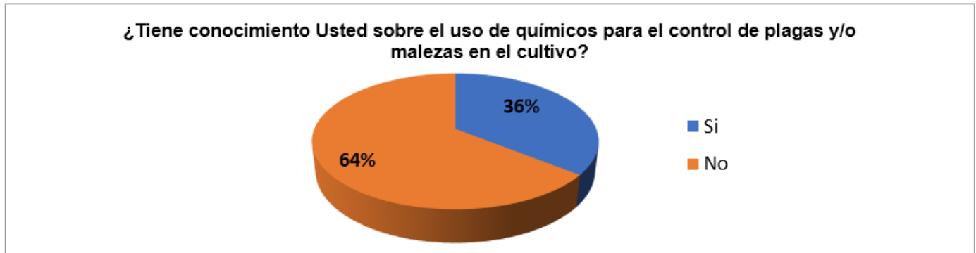
Figura2. Conocimiento sobre el uso de químicos para el control de plagas y/o malezas en el cultivo.

Análisis e interpretación: Dentro de contexto, el uso de plaguicidas juega un papel muy importante en el control de plagas. Sin embargo, estos productos deben ser utilizados en forma racional y adecuada, y siempre como última alternativa de control, pues dada su naturaleza. De acuerdo a lo observado en la tabla y gráfico vemos que un 36% si tiene conocimiento sobre el uso de químicos para el control de plagas y/o malezas en el cultivo y un 64% manifiesta que no posee ningún conocimiento sobre el tema.